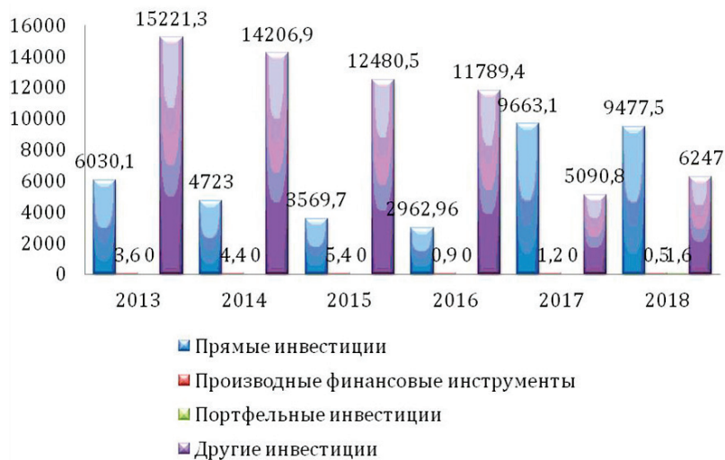
Рис. 3. Инвестиции КНР в экономику РК по состоянию на конец I полугодия 2018 г., в млн долл. США (составлено автором) 7

Однако главным инвестиционным инструментом в 2018 г. стали прямые инвестиции (рис. 3). В конце первого полугодия их сумма составила 9,5 млрд долл. (60,3% от всех инвестиций).