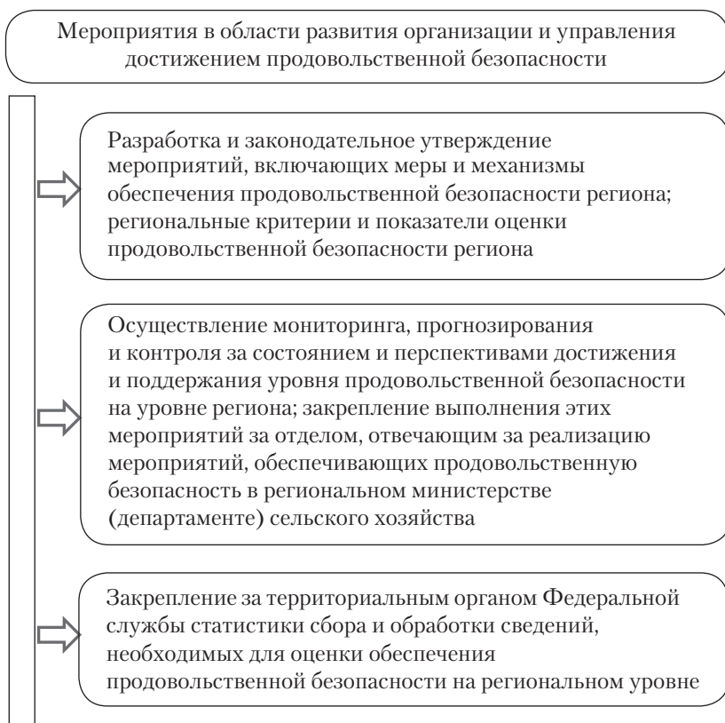
Рис. 1. Мероприятия в области развития организации и управления достижением продовольственной безопасности на региональном уровне

Данные мониторинга по уровню продовольственной безопасности могут быть использованы при разработке региональных стратегий и программ развития субъектов Российской Федерации для эффективной реализации перечня мер социально-экономического развития как в краткосрочной, так и в долгосрочной перспективе. Прежде всего это касается сокращения бедности и имущественного расслоения населения, а также повышения физической и экономической доступности продовольствия.