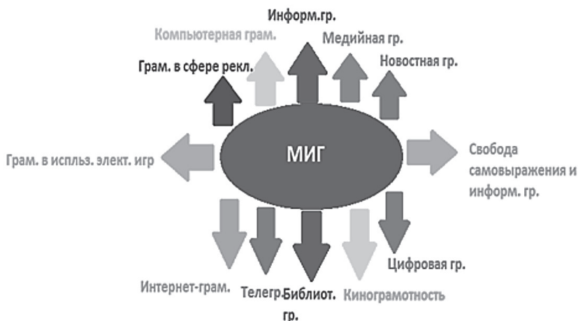
Рис. 3. Экосистема МИГ: основные понятия